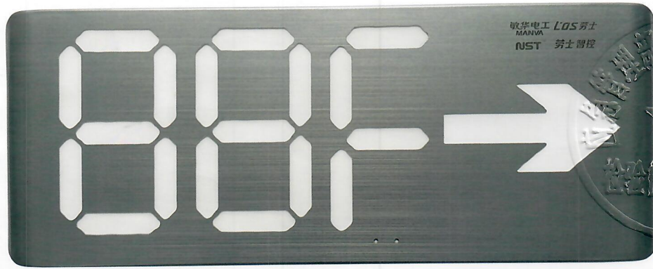
产品型号: N-BLJC-1LR0E II 1WZKY (图 B. 5+图 B. 6 88F)