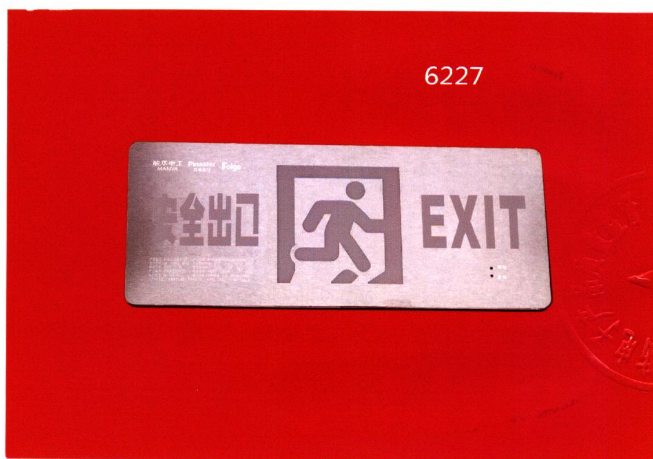
产品型号: M-BLJC-1LR0E I 1WZLM (图 B. 2)