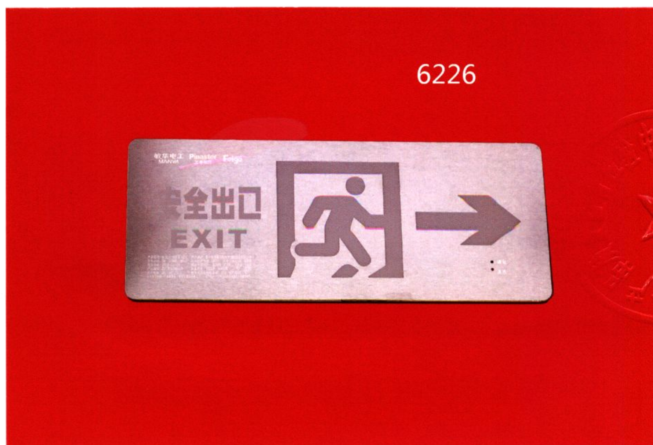
产品型号: M-BLJC-1LR0E I 1WZLM (图 B. 2+图 B. 5)